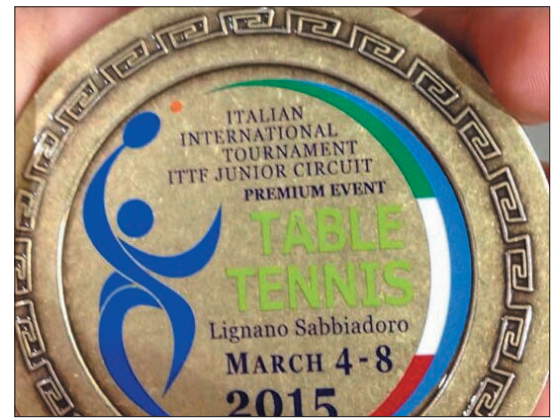
Detalle de la medalla conseguida.

bles en la fase de grupos ante Serbia , Italia y Austria , como en cuartos de final contra Croacia , cediendo ante a la postre campeona del OPEN , Hong Kong . Al final, el bronce.