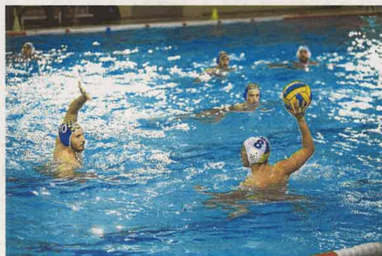
El partido del Inacua comenzará a las 15 horas.

Con respecto a la segunda categoría autonómica, el filial hueteño y el Motril lucharán por acceder a la final de los 'play offs' de ascenso. En ese sentido, los metropolitanos lo