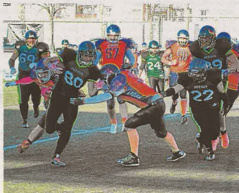
La defensa de Lions no logró frenar el ataque de Potros. :: c. GUIADO

Los Potros ampliaron la renta en el tramo final de una mala tarde la de ayer para los Lions, que se despidieron con lluvia de Maracena, pero con un público que no los abandonó ni por un instante. El fútbol americano no regaló nada a ninguno de los equipos. Ganó, el que mejor supo aprovechar sus oportunidades sobre el campo. Y Potros fue merecido vencedor de la Copa de Andalucía 2016.