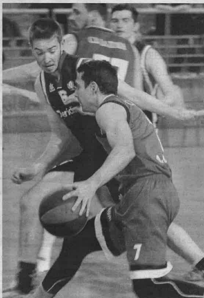
Uno de los lances del derbi disputado ayer.

El Eneluz Costa Motril, por otro lado, logró una meritoria victoria en la cancha del CV Virgen del Carmen de Córdoba. Los motrileños, que han cogido impulso y se han alejado definitivamente de la zona peligrosa de la clasificación, doblegaron