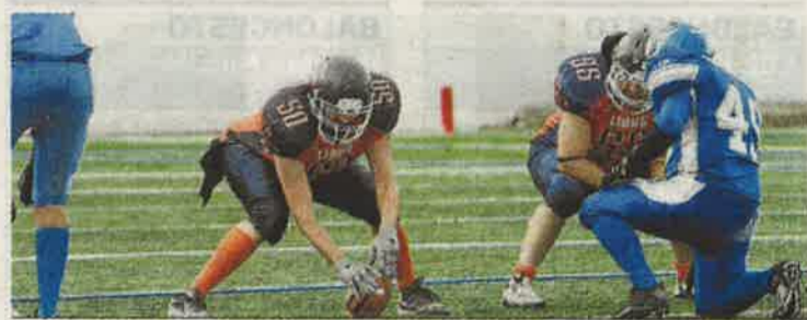
Acción de uno de los partidos de los Granada Lions.

ver varias nuevas anotaciones para el dominador cuadro de Granada que dejaron el luminoso final con una renta clara de 63 puntos a su favor.