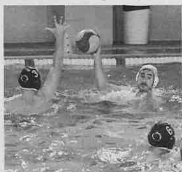
Partido contra Chiclana. :: G. M.

El conjunto entrenado por Pío Salvador se ha mostrado durante toda la temporada a un elevado nivel de competitividad, ganando la mayoría de sus partidos -solo un tropiezo en su trayectoria- con relativa comodidad y amplios marcadores. Esa es la mejor señal de que los nazaries están preparados para el reto de pelear por el ascen-