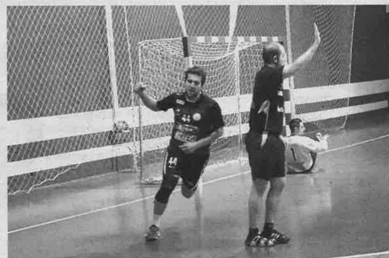
Celebración de un gol del Maracena.

tos ante un oponente como el líder podría otorgar credibilidad a una meta más ambiciosa en los nueve partidos que faltan para la conclusión de la fase regular.